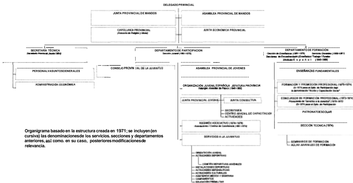
Organigrama basado en la estructura creada en 1971; se incluyen (en cursiva) las denominaciones de los servicios, secciones y departamentos anteriores, así como, en su caso, posteriores modificaciones de relevancia.