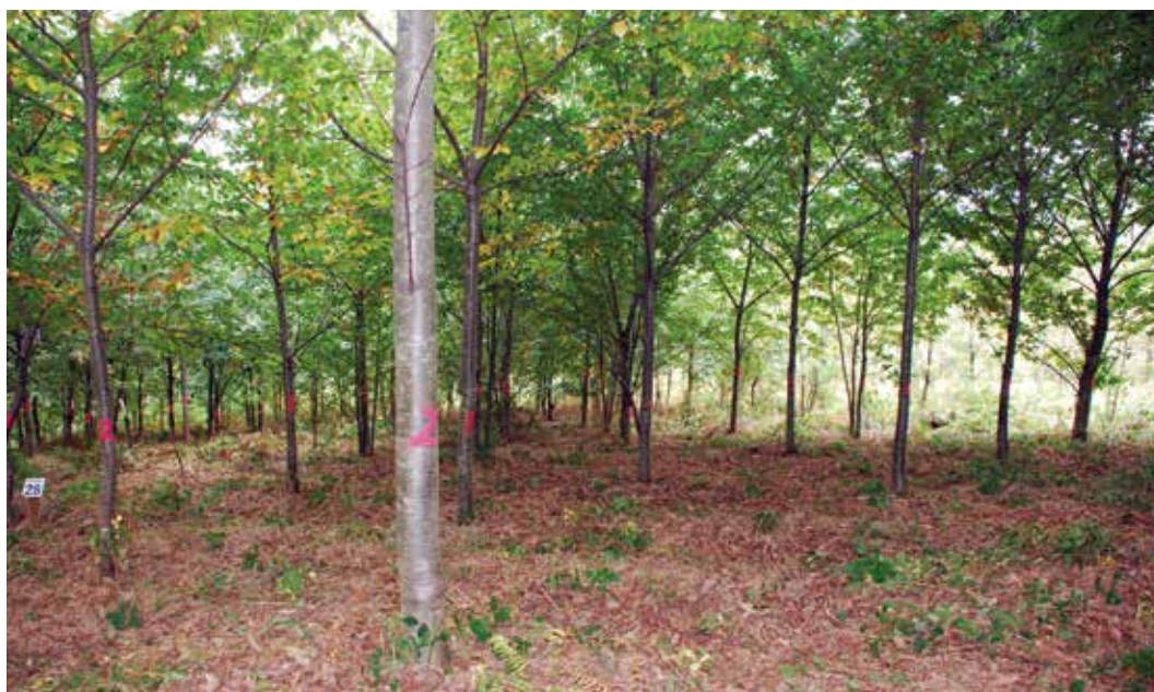
← Figura 3. Material clonal de híbridos de castaño interespecíficos.

región, registrándose recientemente 11 de ellos en la Oficina Española de Variedades Vegetales del Ministerio de Agricultura y Pesca, Alimentación y Medio Ambiente (BOE nº 60, de 11 de marzo de 2017).