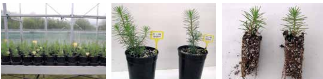
← Figura 1. Vista general de plantas madre (izquierda), detalle de las mismas (centro) y planta clonada (derecha) de pino pinaster.

El cerezo es, y ha sido, muy apreciado como componente de la diversidad de los ecosistemas forestales de toda Europa, donde se extendió procedente de Asia occidental, acompañando al hombre desde tiempos remotos. A nivel mundial, se encuentra difundido por numerosas regiones y países con clima templado (Rusell, 2003), demostrando ser una especie con una gran capacidad de adaptación a distintas condiciones climatológicas, ya que lo podemos encontrar desde Gran Bretaña al Cáucaso y desde el norte de África a los países escandinavos (López-González, 2001; Montero et al., 2003). En España, esta especie se distribuye sobre todo por la mitad norte peninsular, siendo un árbol frecuente en Galicia, especialmente en la mitad oriental de la región (Álvarez et al., 2000), si bien Las Regiones de Identificación y Utilización de material forestal de reproducción (RIU's) números 7 y 9, pre-Pirineo y bosques vasco-navarros, son