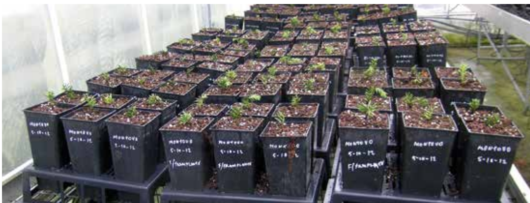
← Figura 8. Clones ya enraizados de los tejos seleccionados por su interés histórico.