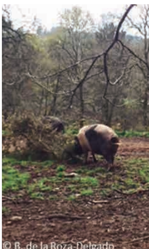
↓ ↘ Foto 1.- Porco Celta (izda.) y Gochu Asturcelta (dcha.) en extensivo.

Estas razas son morfológicamente muy parecidas. Tienen además en común la elevada rusticidad antes mencionada, que les permite ser explotadas al aire libre. Recuperar una raza autóctona carece de sentido si no se adopta de inmediato un sistema de explotación apropiado para ella. Si bien pueden ser alimentados con piensos compuestos elaborados según recomendaciones y requerimientos, la vocación del Porco Celta y Gochu Asturcelta (Foto 1 izda. y 1 dcha.) es claramente el aprovechar durante el verano los estratos arbustivo-subarbustivo y herbáceo de los bosques plano-caducifolios y los frutos (castañas, bellotas y hayucos) durante el otoño e invierno, aunque en función del momento del sacrificio pueden requerir suplementación final con castaña de destrío y/o aporte de pienso.