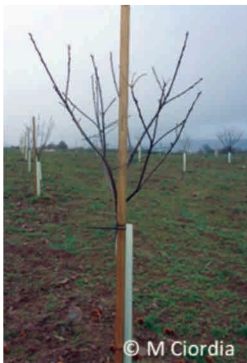
→ Foto 4.-Castaño juvenil podado en vaso.

La poda tipo vaso es el sistema de poda más frecuente en frutales. Se inicia cuando el diámetro del tallo alcanza unos 7 cm en su base, que se guía vertical, y generalmente ayudado de un tutor. Con la primera poda se despunta la planta a una altura de 2-2,5 metros. Las podas posteriores seleccionan tres ramas principales formando entre sí un ángulo de unos 120°, y eliminan las demás ramas que surjan del tallo principal. Sobre las tres ramas irán apareciendo otras de carácter secundario, sobre las que se repite el procedimiento, dejando las que sean más gruesas. Y así sucesivamente, de forma que al