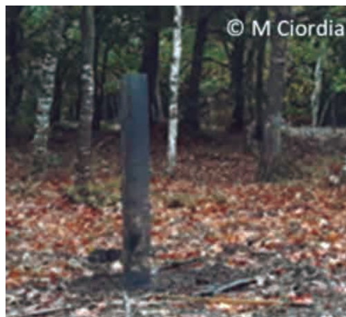
Foto 7.- Castaño protegido con malla negra individual. Jornada demostrativa de plantación de variedades tradicionales de castaño, Friol (Lugo), proyecto CASTACELTA.