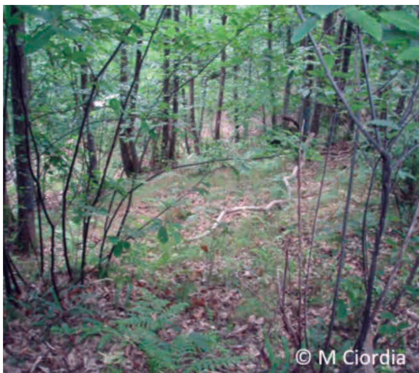
↓ Foto 2.-Flora vascular del monte bajo de castaño.

Tradicionalmente, la gestión se ha realizado a través de cortas a matarrasa ca-