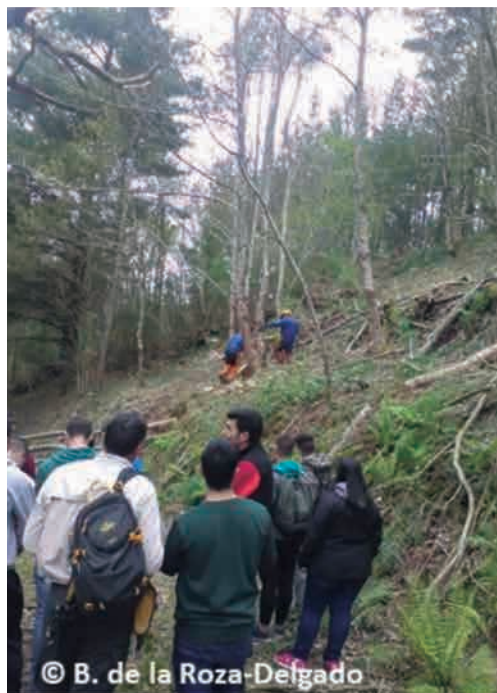
← Foto 3.-Jornada demostrativa de claras en el monte bajo de castaño de Sela da Loura (Vegadeo, Asturias), proyecto CASTACELTA.

Las recomendaciones existentes en Galicia y Asturias para el castaño se recogen en la Orden del DOG nº 106 de 2014/6/5 de la Xunta de Galicia y en el Catálogo de Modelos Selvícolas del Principado de Asturias (2015).