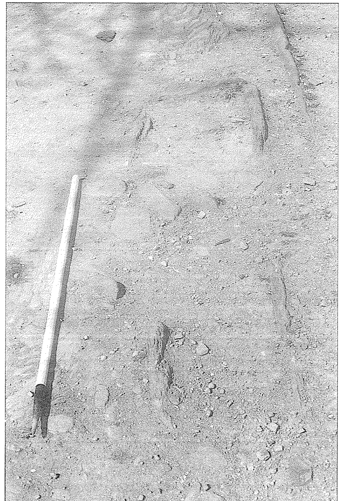
Tumba 2. Conforcos / 30-IV-90

Tumba I. Es la tumba que se ha conservado en mejores condiciones, cerrada tanto en la cabecera como en los pies. Tiene una orientación E-W y mide 1,80 m. de largo por 0,50 de ancho. Las lajas visibles son estrechas, de 6 a 8