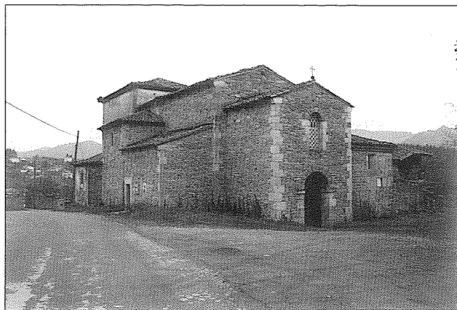
Fig. 1.—Iglesia prerrománica de Santianes de Pravia.

La investigación arqueológica en el municipio, caso anómalo en el contexto regional, resulta abundante y variada 2 . Podemos considerar que arranca en el siglo XVII con los comentarios de Carvallo a las iglesias de Santianes y San Andrés, a la malatería de Villafría y el castro del Cogollo de Selgas. A caballo entre los siglos XVIII y XIX, además de las interesantes notas que Jovellanos incluye en sus Diarios sobre diferentes sitios, destaca la importantísima obra de Antonio Juan de Banzas y Valdés, concebida como informe para el Diccionario de Martínez Marina. Este trabajo, pionero en lo que se refiere a la investigación arqueológica de carácter científico de Asturias, incluye gran número de yacimientos acompañados de atinadas observaciones y descripciones de los mismos. De entre el resto de trabajos del siglo XIX debemos destacar el estudio que realiza Fortunato de Selgas sobre Santianes de Pravia.