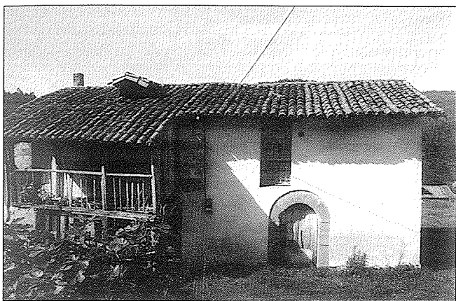
Fig. 3.—Casa bajomedieval de Cañedo.

zanas y las capillas de La Virgen del Valle, San Vicente La Braña, Sta. Catalina, La Madalena de Bances, Sta. Olaya y Villarigán. De entre todas ellas podemos destacar las estructuras prácticamente íntegras de Agones o Pronga, la cabecera de La Madalena de Bances y, especialmente, la cabecera de Quinzanas, con unos interesantes restos de pinturas murales que carecen de un estudio adecuado.