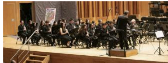
El concierto de clarinete en el Auditorio. MIKI LÓPEZ

Ciento veinte clarinetistas se subieron ayer al escenario del auditorio Príncipe Felipe, en Oviedo, en el concierto "Originalidad y arreglos", celebrado en homenaje a la mujer. El recital forma parte del proyecto de innovación académica "Creando sinergias", dirigido y coordinado por el catedrático de Clarinete del Conservatorio Superior de Música