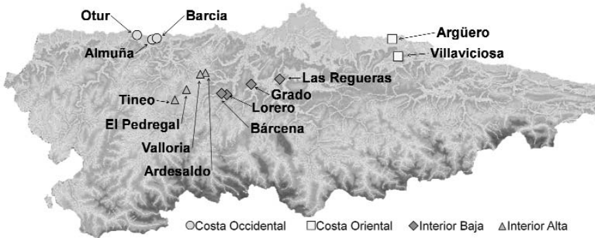
Figura 2. Localización de los campos de ensayo correspondientes a las cuatro zonas edafoclimáticas