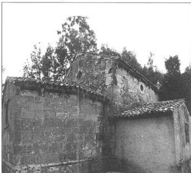
Sta. M. a de Sebrayo antes de la restauración: cabecera románica, añadido del s. XV y nave del s. XIX-XX.

El principal argumento de la existencia de un templo anterior al románico, proviene de la reutilización de un epígrafe del siglo X (García de Castro 1995) como dintel en la puerta de acceso a la Capilla/Sacristía. La excavación ha permitido obtener un nuevo indicio, al localizarse una tumba de lajas que ha sido pisada y destruida por la cimentación románica del ábside (N7 del cuadro B5).