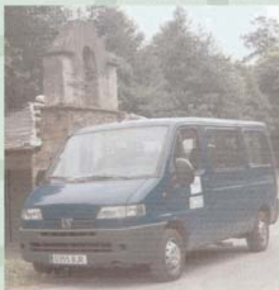
Servicios de transporte