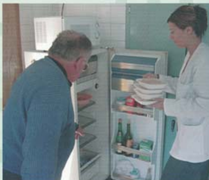
Servicio de comida a domicilio