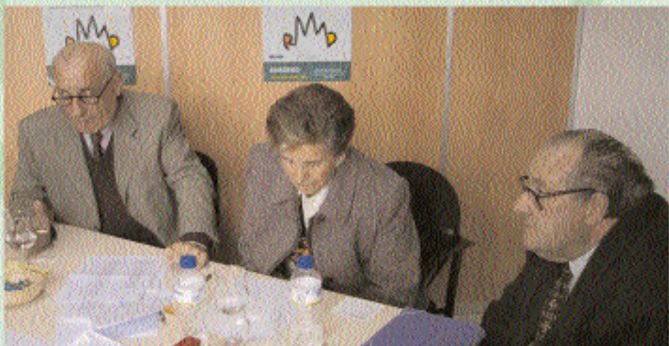
Promoción del asociacionismo de personas mayores