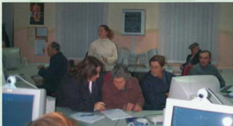
Promoción del acceso a las nuevas tecnologías

b) El ocio, la cultura y la educación. Potenciando actividades que, además de contribuir al fomento de la relación social, se dirijan a promover intereses culturales, a posibilitar una formación permanente de las personas mayores así como impulsar su incorporación al mundo de las nuevas tecnologías (aulas de educación de adultos, conocimiento del medio, cursos de programas informáticos, manejo de internet, creación de grupos musicales, de teatro...).