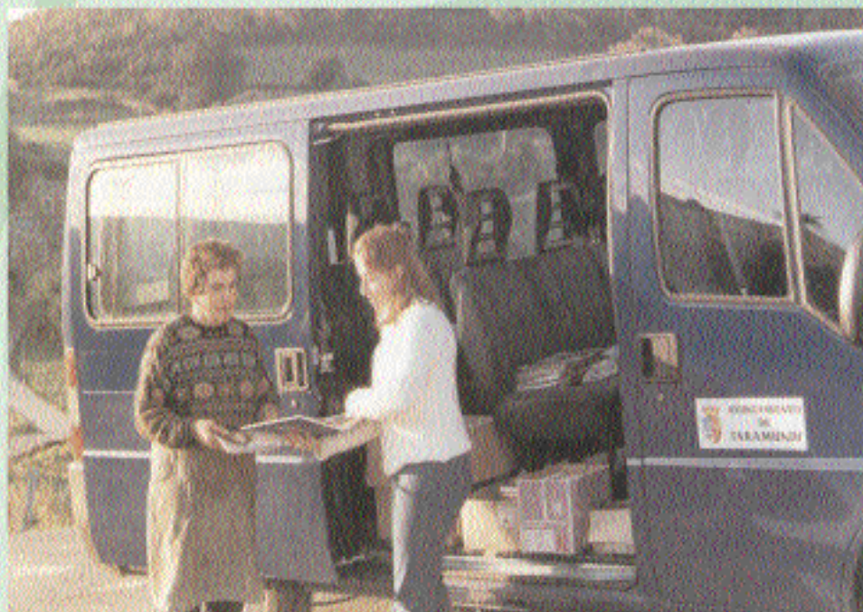
Servicio de biblioteca ambulante

gramas de orientación a la realidad, grupos de conversación, tertulias, actividades lúdicas y recreativas, etc.