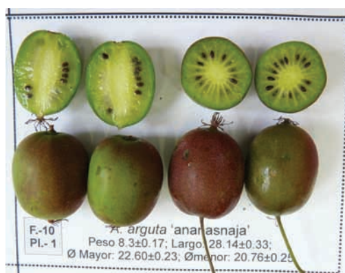
→ Baby kiwi cv. 'Ananasnaja'.

Son muy resistentes al frío invernal, dado que su origen es de la zona del Ártico y Asia oriental. Aunque la mayoría de los machos de cada una de las dos especies citadas podría actuar como poliniza-