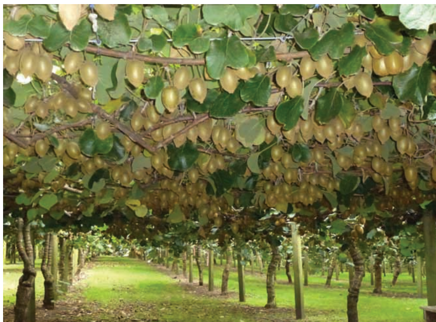
↑ Plantación de kiwi amarillo.

milla. Se distingue de otras variedades por la frondosidad de su vegetación y el verde intenso de su follaje. Tiene las flores ligeramente más pequeñas que 'Hayward' y florece unos días antes que éste. El fruto es de tamaño medio, de 60 a 70 g y de forma totalmente cilíndrica. La piel es de color marrón oscuro, con mucha vellosidad, pelos largos y duros. La pulpa es verde translúcida, acidulada y contiene más vitamina C que la mayoría de variedades. Se recolecta una semana antes que 'Hayward'. La conservación frigorífica es muy inferior a ésta.