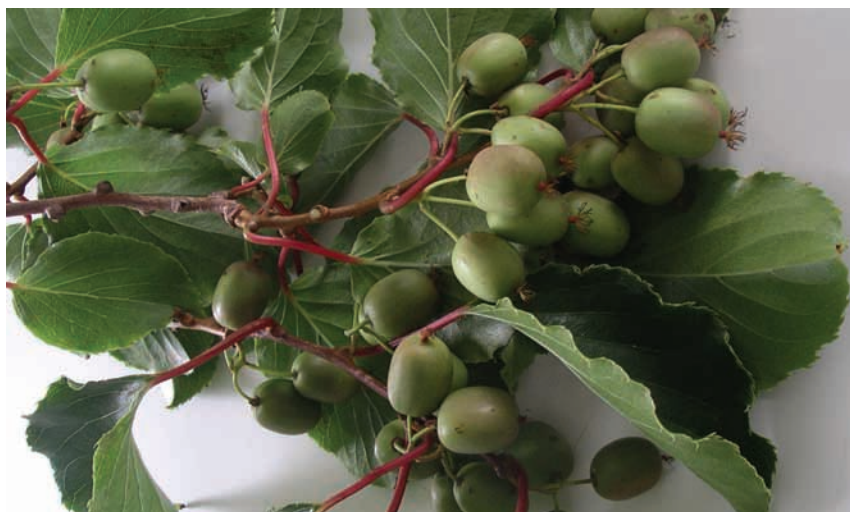
↑ Rama con frutos de Baby Kiwi.