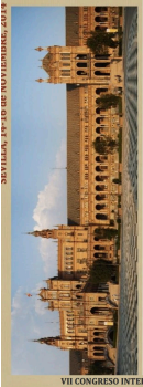
VII CONGRESO INTERNACIONAL Y XII NACIONAL DE PSICOLOGÍA CLÍNICA SEVILLA, 14-16 de NOVIEMBRE, 2014