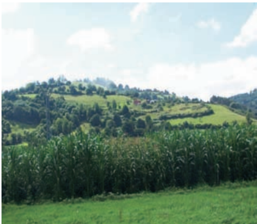
↑ Figura 5. -Campo de evaluación de poblaciones locales de maíz en manejo ecológico en Grado (zona interior baja de Asturias).

en la misma zona del ensayo “Zona interior baja de Asturias” en los ensayos de evaluación de variedades comerciales de maíz que el SERIDA viene realizando desde 1996.