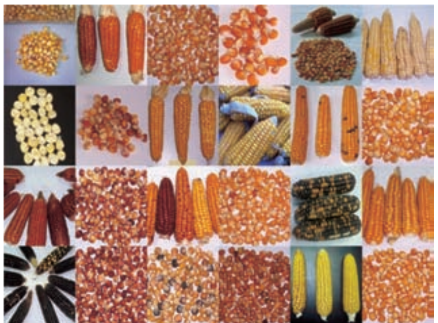
↓ Figura 2.-Poblaciones locales de maíz recuperadas en prospecciones realizadas en varios puntos de la geografía asturiana.

Desde el año 2007, dentro del Programa de Investigación sobre Pastos y Forrajes del Servicio Regional de Investigación