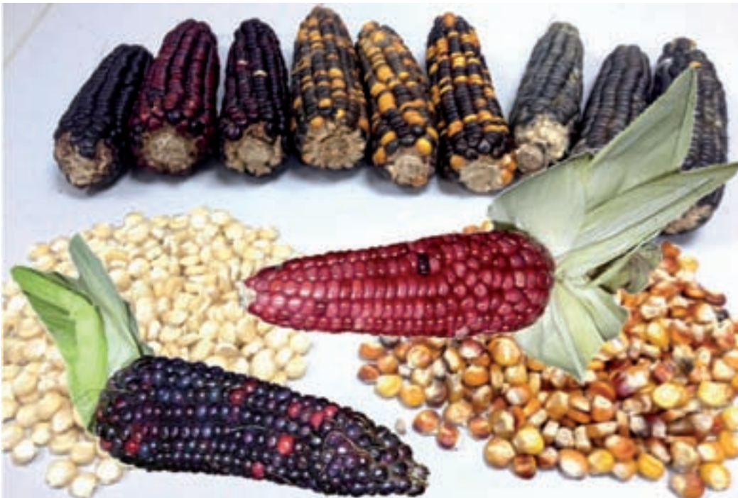
← Figura 1. Alguna de las poblaciones locales de maíz recuperadas a lo largo de la geografía asturiana y pendientes de evaluación.