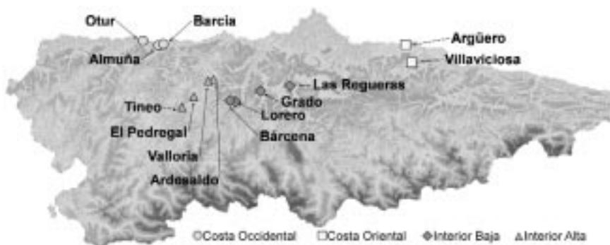
Figura 2. Localización de los campos de ensayo correspondientes a las cuatro zonas edafoclimáticas