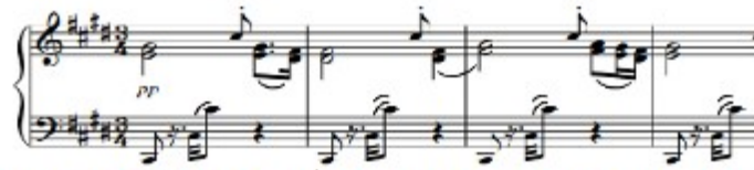
Figura 59. Schubert: Sonata D. 960, 2º mov: Tema A (cs.1-4)