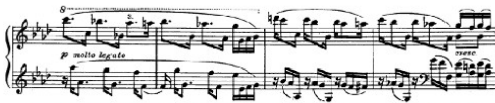
Figura 7. Beethoven: Sonata Op. 110, 1 o mov: Tema B (cs.20-23)