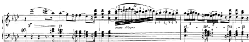
Figura 17. Beethoven: Sonata Op. 111, 1 o mov: Tema B (cs. 50-54)