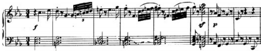
Figura 25. Beethoven: 32 Variaciones Woo 80, Tema (cs.1-8)