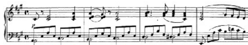
Figura 49. Schubert: Sonata D. 959, 4 o mov: Tema A (cs. 1-4)