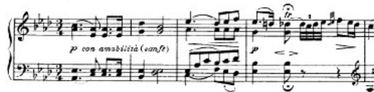
Figura 6. Beethoven: Sonata Op. 110, 1 o mov: Tema A (cs. 1.5)