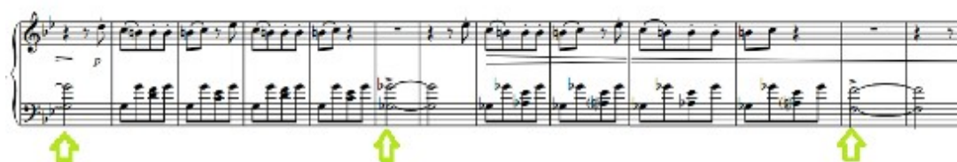
Figura 69. Schubert: Sonata D. 960, 4 o mov (cs. 491- 503)