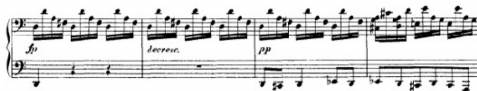
Figura 28. Schubert: Sonata D. 958, 1 o mov: Tema nuevo del desarrollo (cs. 117-120)