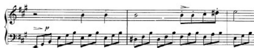
Figura 52. Schubert: Sonata D. 959, 4 o mov: Tema B (cs. 46-48)