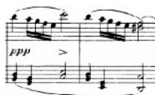
Figura 51. Schubert: Sonata D. 959, 1 o mov, célula transformada (cs. 121-122)