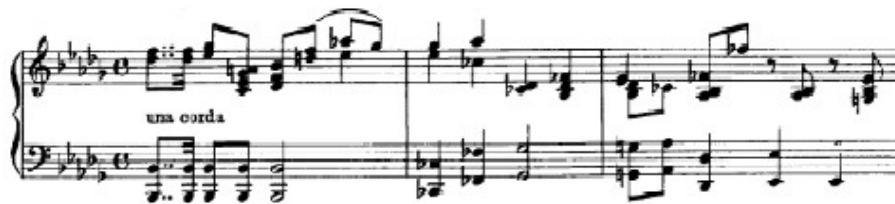
Figura 11. Beethoven: Sonata Op. 110, 3 o mov: 1 a sección (cs. 1-3)