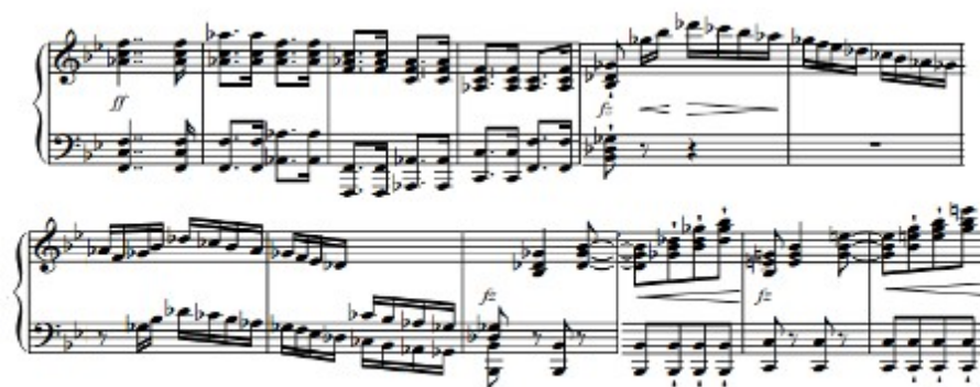
Figura 68. Schubert: Sonata D. 960, 4 o mov: Tema C (cs. 156-167)