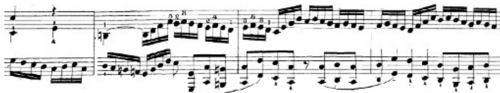
Figura 16. Beethoven: Sonata Op. 111, 1 o mov: Desarrollo (cs. 35-38)