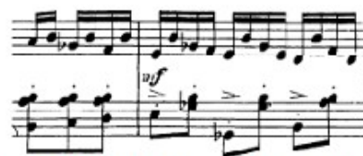
Figura 26. Schubert: Sonata D. 958, 1° mov, Variación sobre el Tema B (cs. 67-68)