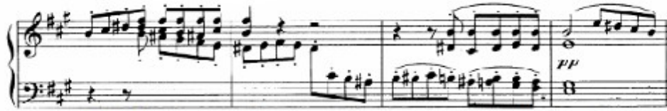
Figura 39. Schubert: Sonata D. 959, 1 o mov, transición al Tema B (cs. 52-55)