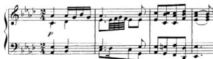
Figura 30. Schubert: Sonata D. 958, 2 o mov: Tema A (cs. 1-4)