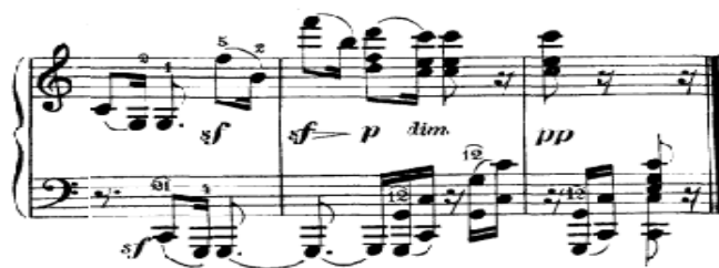
Figura 22. Beethoven: Sonata Op. 111, 2 o mov: Final (cs. 175-177)