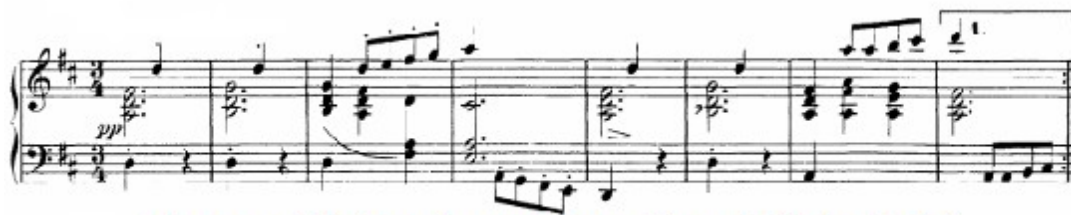
Figura 47. Schubert: Sonata D. 959, 3 o mov: Trío (cs. 80-87)