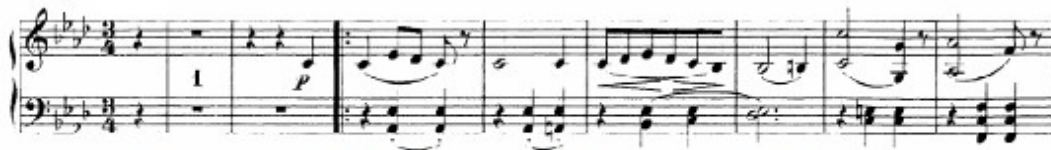
Figura 33. Schubert: Sonata D. 958, 3 o mov: Trío (cs. 42-50)