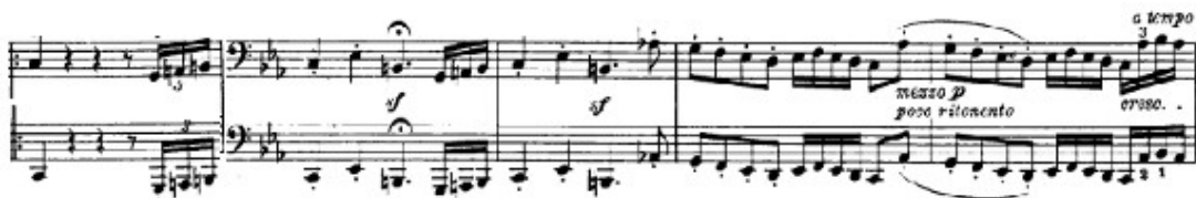
Figura 15. Beethoven: Sonata Op. 111, 1 o mov: Tema A (cs. 19-23)