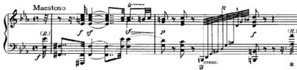
Figura 14. Beethoven: Sonata Op. 111, 1 o mov: Introducción (cs. 1-2)