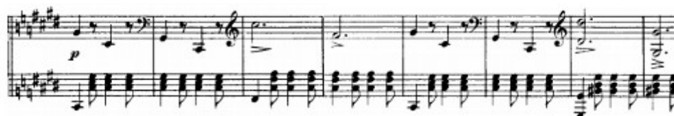
Figura 36. Schubert: Sonata D. 958, 4 o mov : Tema B (cs.113-120)