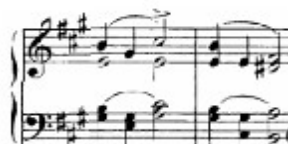
Figura 50. Schubert: Sonata D. 959, 1 o mov (cs. 119-120)