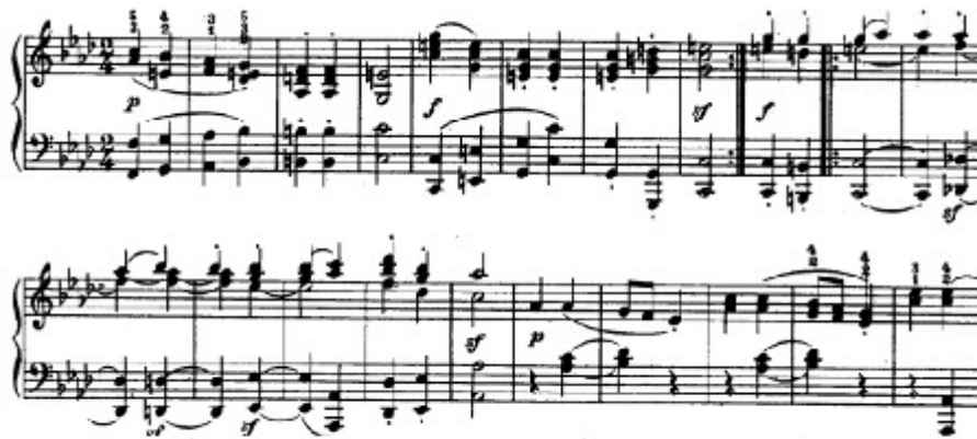
Figura 10. Beethoven: Sonata Op. 110, 2 o mov: Tema A (cs. 1-21)