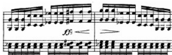
Figura 31. Schubert: Sonata D. 958, 2 o mov, Tema B (cs. 38-39)