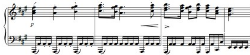
Figura 60. Schubert: Sonata D. 960, 2º mov: Sección B (cs. 43-46)