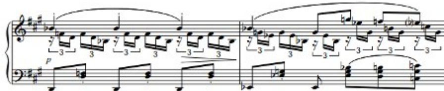
Figura 61. Schubert: Sonata D. 960, 2º mov (cs. 80-81)