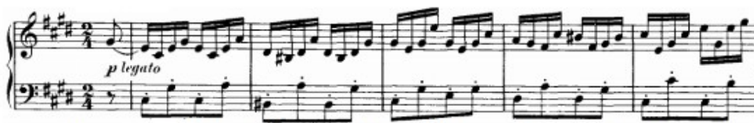
Figura 27. Schubert: Momento Musical D. 780 n° 4, comienzo (cs. 1-5)