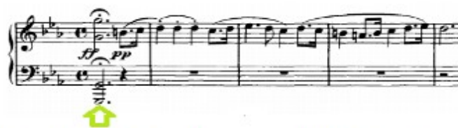
Figura 65. Schubert: Impromptu D. 899 n° 1 (cs. 1-5)