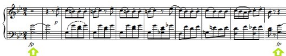
Figura 66. Schubert: Sonata D. 960, 4 o mov: Tema A (cs. 1-10)