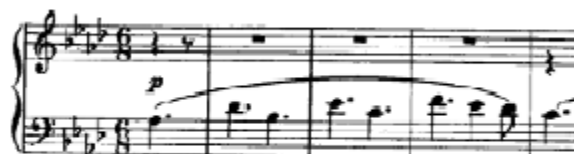
Figura 12. Beethoven: Sonata Op. 110, 3 o mov: Fuga (cs. 1-5)