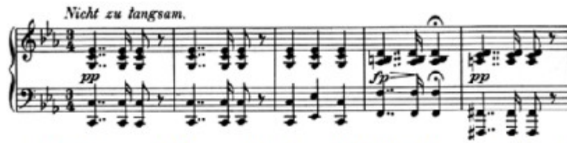
Figura 23. Schubert: El Canto del cisne, Lied n° 2: Introducción (cs. 1-5)