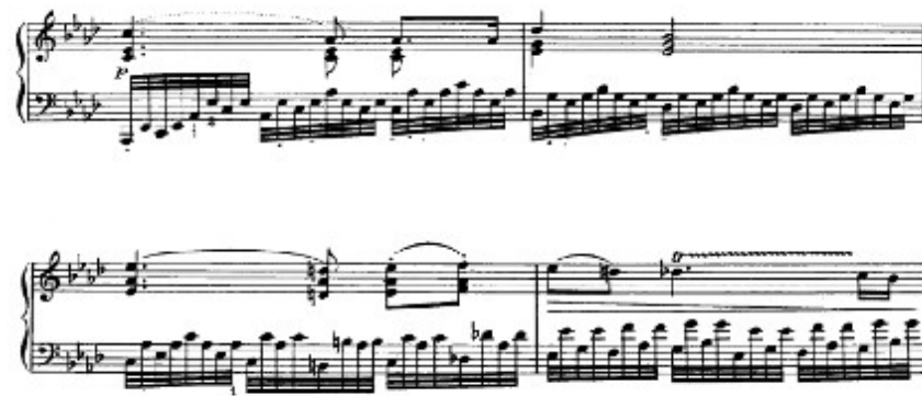
Figura 9. Beethoven: Sonata Op. 110, 1 o mov: Tema A (cs.56-59)