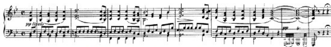
Figura 55. Schubert: Sonata D. 960, 1 o mov: Tema A (cs. 1-9)