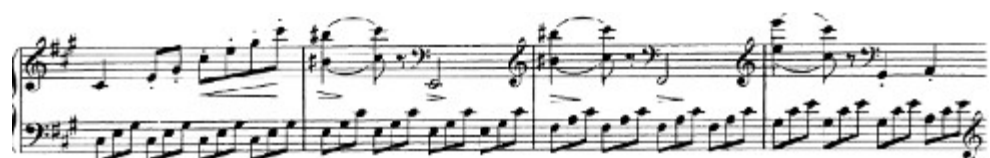
Figura 53. Schubert: Sonata D. 959, 4 o mov: Desarrollo (cs. 179-182)