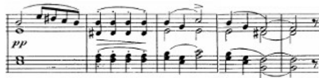
Figura 40. Schubert: Sonata D. 959, 1 o mov: Tema B (cs. 55-59)