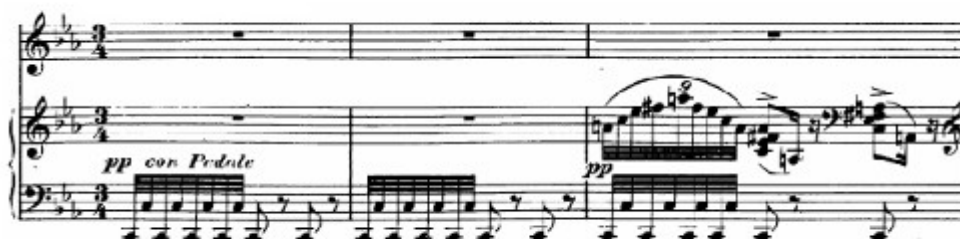
Figura 29. Schubert: El Canto del Cisne, Lied n o 11 (cs. 1-3)