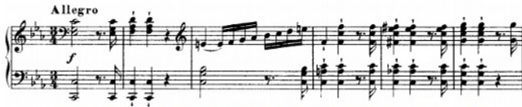
Figura 24. Schubert: Sonata D. 958, 1° mov: Tema A (cs. 1-6)