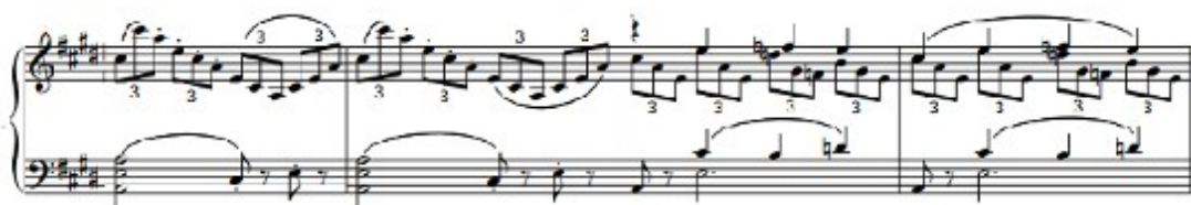
Figura 57. Schubert: Sonata D. 960, 1 o mov: Desarrollo (cs. 131-134)