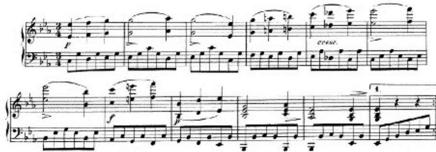
Figura 32. Schubert: Sonata D. 958, 3 o mov, Tema (cs. 1-12)