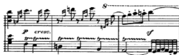
Figura 8. Beethoven: Sonata Op. 110, 1 o mov: ascensión luminosa (cs. 25-27)