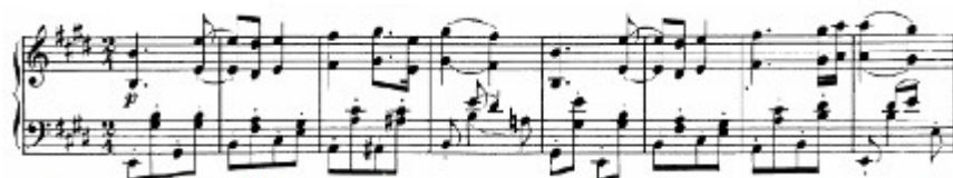
Figura 48. Schubert: Sonata D. 537, 2 o mov: Tema A (cs. 1-8)