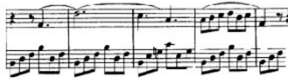
Figura 37. Schubert: Sonata D. 958, 4 o mov: Desarrollo C (cs. 246-250)