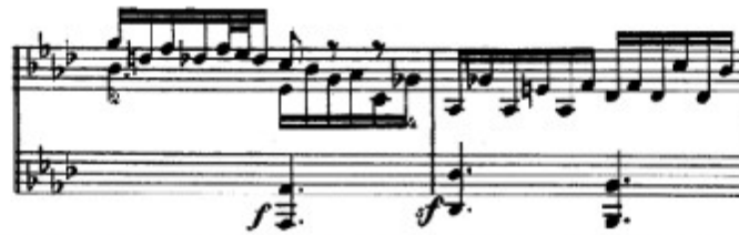
Figura 13. Beethoven: Sonata Op. 110, 3 o mov (cs. 174 - 175)