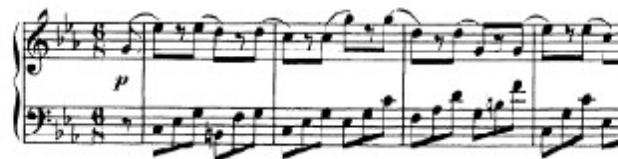
Figura 34. Schubert: Sonata D. 958, 4 o mov: Tema A (cs. 1-4)