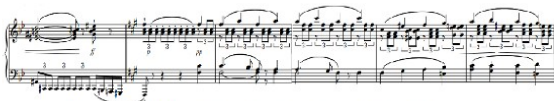
Figura 56. Schubert: Sonata D. 960, 1 o mov: Tema B (cs. 47-52)