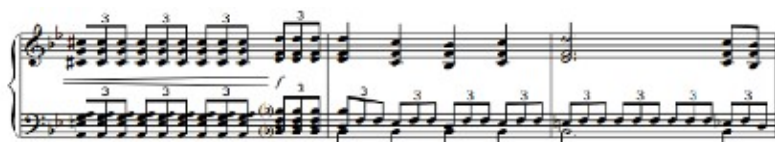
Figura 58. Schubert: Sonata D. 960, 1 o mov: Tema A Rexpresión (cs. 253-255)