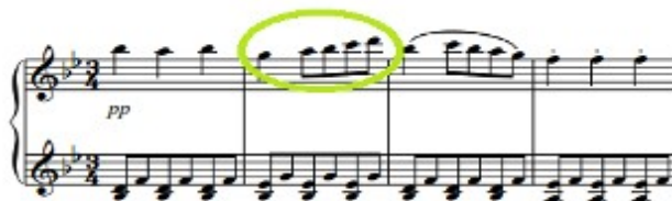
Figura 62. Schubert: Sonata D. 960, 3º mov: Tema (cs. 1-4)