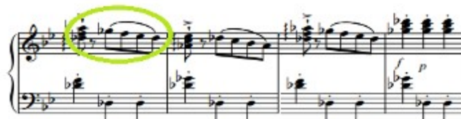
Figura 63. Schubert: Sonata D. 960, 3º mov, Tema en espejo (cs. 35-38)