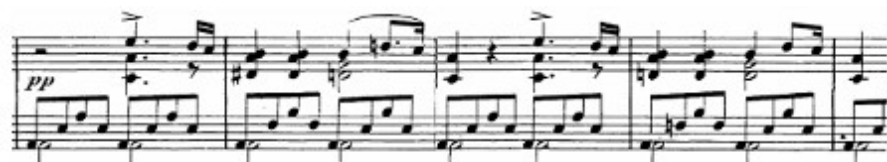
Figura 54. Schubert: Sonata D. 959, 4 o mov: Coda (cs. 368-372)