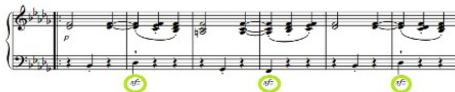
Figura 64. Schubert: Sonata D. 960, 3º mov: Trío (cs. 91-96)