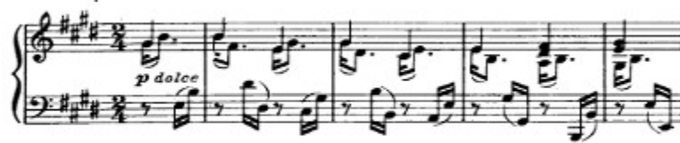
Figura 1. Beethoven: Sonata Op. 109, 1 o mov: Tema A, (cs. 1-5).