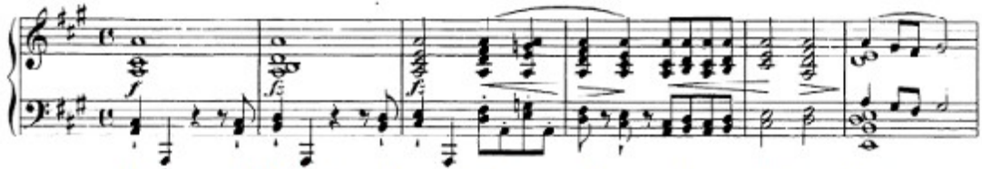
Figura 38. Schubert: Sonata D. 959, 1 o mov: Tema A (cs. 1-6)