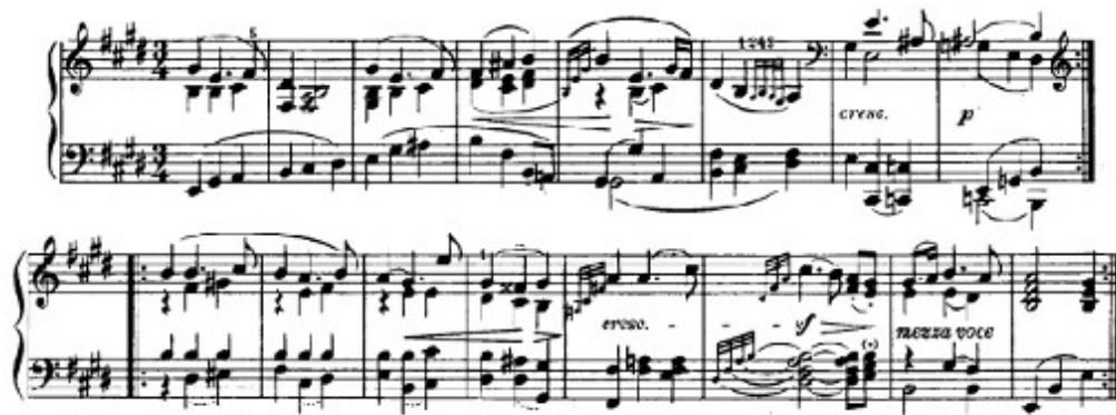
Figura 5. Beethoven: Sonata Op. 109, 3 o mov: Tema A (cs. 1-16)