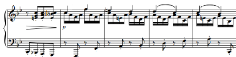
Figura 67. Schubert: Sonata D. 960, 4 o mov: Tema B (cs. 95-99)